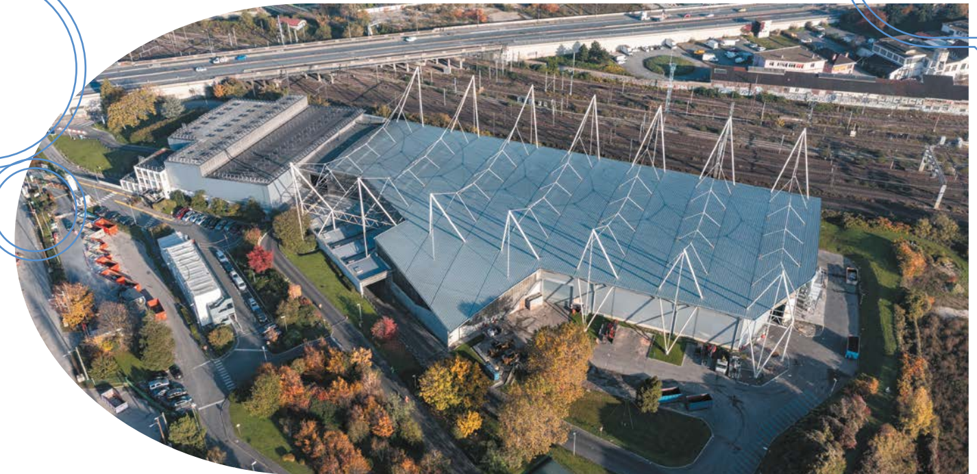
Vue aérienne du site actuel