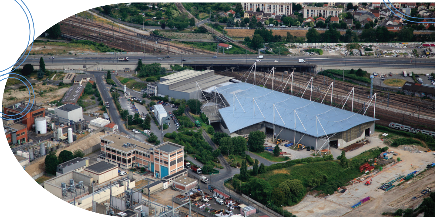
Vue aérienne du site